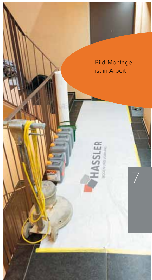
Bild-Montage ist in Arbeit